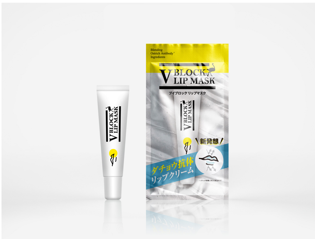
V BLOCK LIP MASK (10g)

V BLOCK LIP MASK (ブイブロック リップマスク)をリリースいたします。 (2020年10月末発売予定)